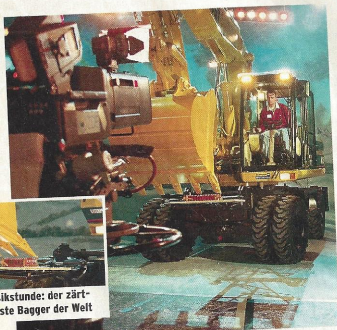
Musikstunde: der zärtlichste Bagger der Welt